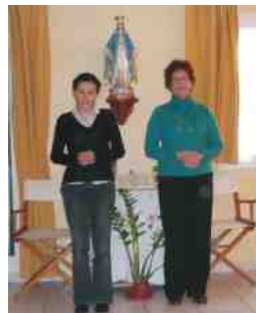
Una pequeña HME

¡Todo es posible para el que cree; y creemos firmemente que esta fundación saldrá adelante con la ayuda de Dios y nuestro esfuerzo humano. Que muchas de esas vocaciones que surgen en Cursillos tendrán en esta fundación el lugar donde poder realizar plenamente su vocación evangelizadora.