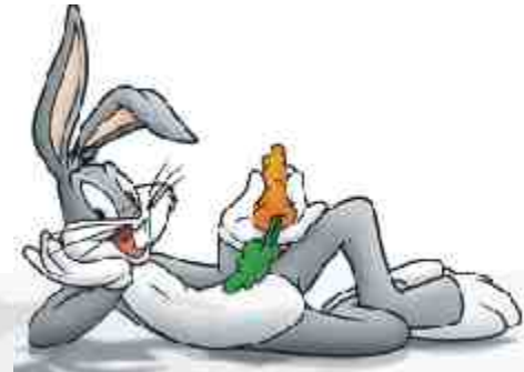
Bugs Bunny, el conejo de la suerte

Tengo por delante todo el curso 2007/2008. Un año que viene cargado con las viejas losas que aparqué en vacaciones, con las mismas cruces y con otras nuevas. Mi curso, como el de cualquiera, viene repleto de proyectos, retos, trabajo, tareas pendientes, flecos por hilvanar, esfuerzos, angustias por sufrir, éxitos por celebrar, alegrías que disfrutar... de vida por ser vivida. Y no quiero que en esa amalgama de realidades nuevas y viejas ninguna se p a s e