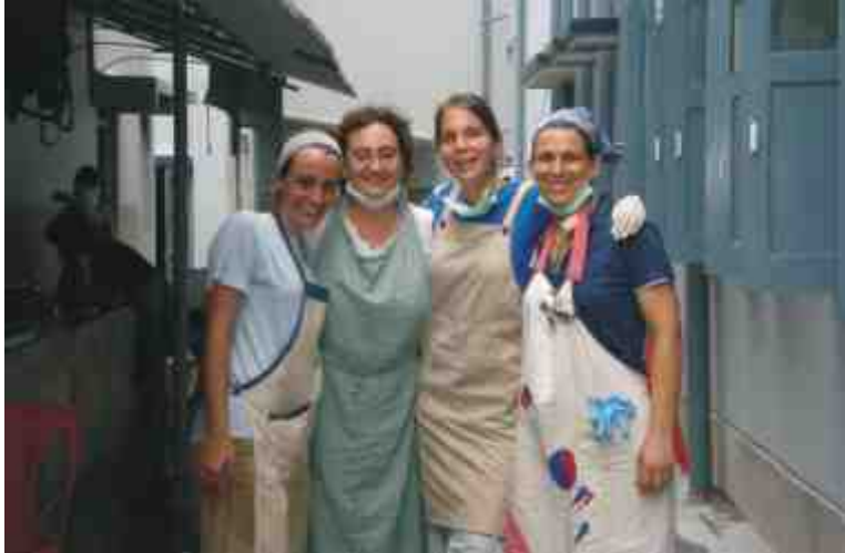
Misioneras de la caridad

ños, hindúes y musulmanes, que están totalmente abandonados por los suyos y por la sociedad. Es una delicia ver cómo ellas solo son un pobrecillo instrumento para que el amor verdadero, el tierno y eterno amor de Dios, llegue a todas sus criaturas, a los voluntarios que llegamos allí pobres, muy pobres de Espíritu, y a los más débiles y pobres entre los pobres de Calcuta.