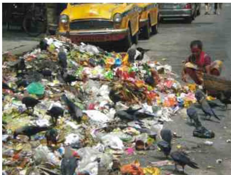
Basura en una calle de Calcuta

Calles llenas de gente pobre viviendo en las aceras, niños entre montones de porquería, ratas y cuervos. Esto está muy lejos de ser pobreza... es la miseria más absoluta, con el agravante de ser una miseria culturalmente aceptada, con todo lo que ello conlleva de sometimiento y esclavitud. Es incomprensible, tremendo!!!