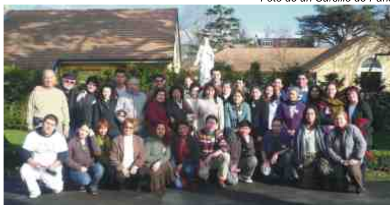
Foto de un Cursillo de Paris

Quizás, tú que lees esta historia, seas uno, o una de ellos. Si es así, si ves que eso es lo que el Señor quiere para ti, no tengas miedo, no dudes y adelante, piensa que en ello te va la Felicidad.