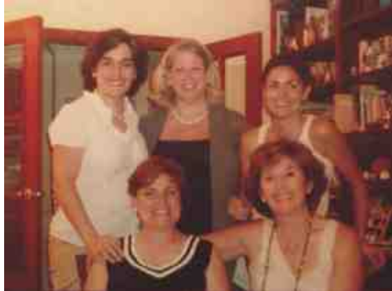
Reunión de grupo de Queralt

gación y mi vocación el atenderles. También tuve la suerte de tener desde el principio una Reunión de Grupo. Una Reunión de Grupo que se ha ido formando y consolidando con los años. El Señor nos quiere mucho y nos quiere santas.