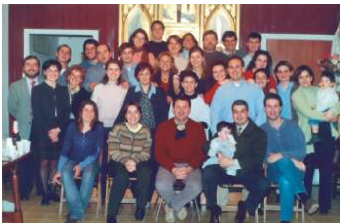
Aquel “germen” de Cristo del Amparo en su primer cumpleaños