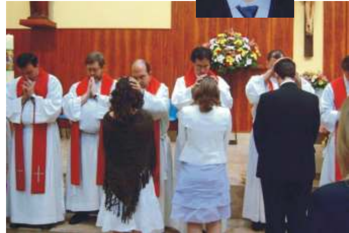
Imposición de manos